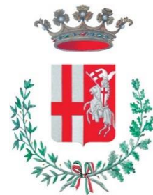
Città di Spoleto

Comune di Spoleto, € 4.000,00 per il programma di musica, di spettacoli, di cinema, di trekking al fine di favorire la ripresa culturale, dopo lo stop dovuto alla pandemia.